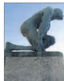
I GÅR: Sprinteren står utenfor Brann stadion