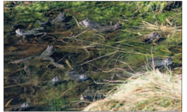
FROSKEDAM: På tur fra Løvtakken mot Breistølen ser fotografen noe han ikke har sett før: En dam full av frosker. Se nøye etter så oppdager du froskebena.

Send dine blinkskudd til leserbilder@bt.no eller på mobilfoto til 2211. Hver måned kårer vi en vinner som får flaxlodd i posten.