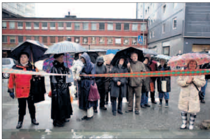
FOLK I FARTA: Gatefest ble det, men litt færre enn ventet strømmet til på grunn av regnværet.