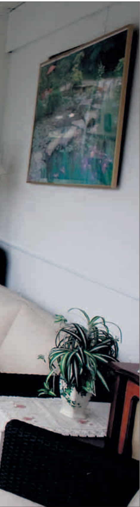
fasaden, men så tok Heggholmen grep.

BTs leserombud Terje Angelshaug tar imot ros og ris fra leserne, tlf. 55 21 46 83 – leserombud@bt.no